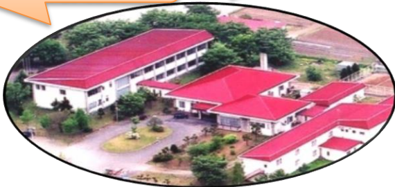
農村保健研修センター 緑色の案内看板